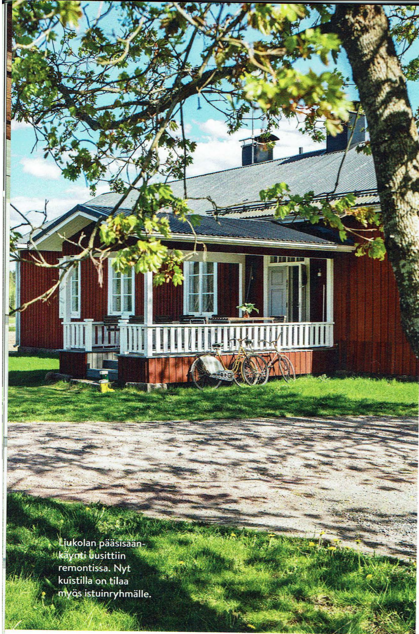
Liukolan pääsisäänkäynti uusittiin remontissa. Nyt kuistilla on tilaa myös istuinryhmälle.