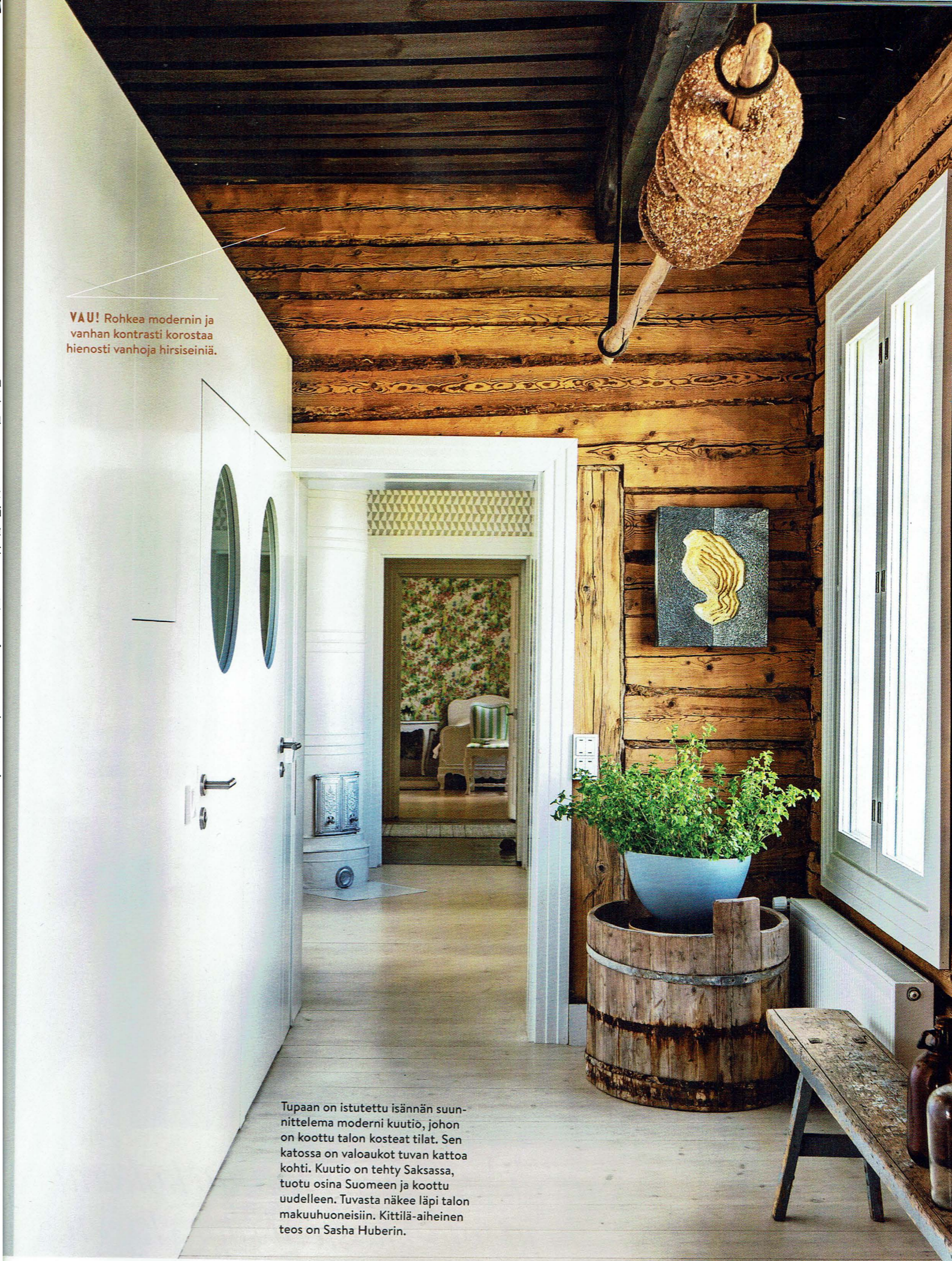
Tupaan on istutettu isännän suunnittelema moderni kuutio, johon on koottu talon kosteat tilat. Sen katossa on valoaukot tuvan kattoa kohti. Kuutio on tehty Saksassa, tuotu osina Suomeen ja koottu uudelleen. Tuvasta näkee läpi talon makuuhuoneisiin. Kittilä-aiheinen teos on Sasha Huberin.

VAU! Rohkea modernin ja vanhan kontrasti korostaa hienosti vanhoja hirsiseiniä.