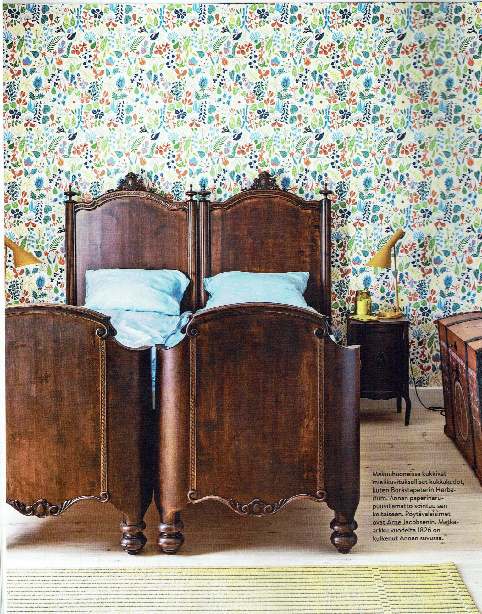
Makuuhuoneissa kukkivat mielikuvittelliset kukkakadot, kuten Boråstapeterin Herbarium. Annan paperinaru-puuvillamatto sointuu sen keltaiseen. Pöytävalaisimet ovat Arne Jacobsenin. Matkarukku vuodelta 1826 on kulkenut Annan suvussa.

seen. Kokonaisuus on ajaton ja silti ajassa kiinni, talon tunnelma lämmin ja rauhallinen. Kaikkialla näkyy, että tässä talossa arvostetaan yksityiskohtia. Erityistä huomiota on kiinnitetty valaistukseen, jonka avulla sisustuksen saa eloon.